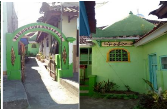
Gambar 3. Situs Mesjid Keramat di Jalan Hasanuddin, Kampung Baru Sumber: www.dapobud.kemdikbud.go.id .

Kawasan Eks Pelabuhan Buleleng dan Kampung Bugis berdasarkan data yang tercatat pada buku Kecamatan Buleleng Dalam Angka Tahun 2019 merupakan area permukiman di daerah pantai seluas ±30 Ha dengan luasan terbangunnya seluas 27,20 Ha dan Kampung Bugis tersebut dihuni oleh 2.979 orang penduduk. Disebutkan juga bahwa Kelurahan Bugis ini cukup padat dimana kepadatan penduduk per km 2 adalah 9.930 jiwa/km 2 . Data tersebut menunjukkan