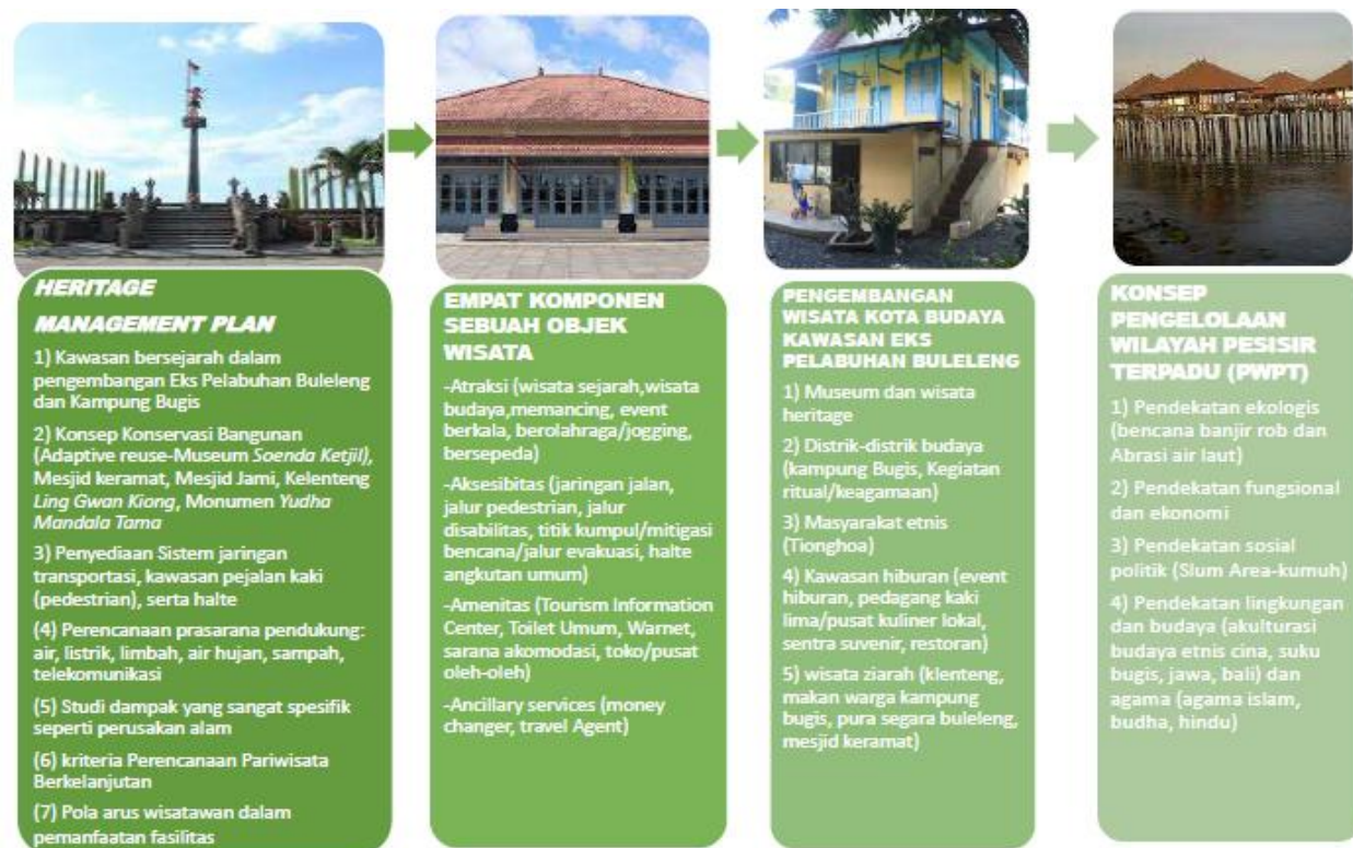
Gambar 6. Strategi Pengembangan Kawasan Strategis Eks Pelabuhan Buleleng

Aktifitas yang ramai pada Pelabuhan Buleleng memberi pengaruh pada kawasan disekitar pelabuhan yang mulai menjadi kawasan perdagangan. Deretan pertokoan mulai bermunculan di kawasan ini, sebagai sarana jual-beli barang distribusi pelabuhan. Pertokoan ini sebagian besar dimiliki oleh kaum dari etnis Cina, yang memang terkenal sebagai bangsa pedagang. Tempat Ibadat Tridharma (T.I.T.D) atau Kelenteng Ling Yuan Gong berada di Eks. Pelabuhan Buleleng-Kabupaten Buleleng. Tempat ibadat ini didirikan pada tahun 1873 Masehi oleh Dinasti Qing. Hal ini diketahui berdasarkan dari prasasti yang terpasang di dalam kelenteng yang terletak di atas patung utama Yang Mulia Toa Kong Co Tan hu Cin Jin bertuliskan Tan Hu Cin Jin dalam aksara Tionghoa. Kelenteng Ling Yuang Gong atau yang lebih dikenal Kelenteng Ling Gwan Kiong