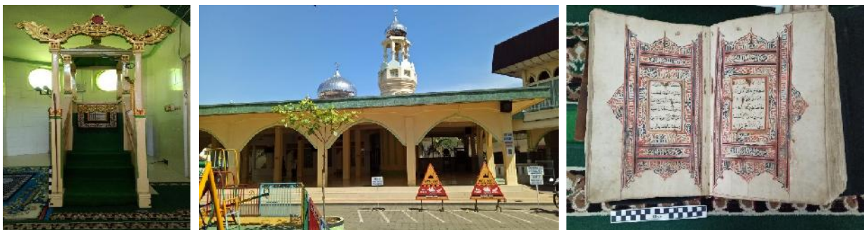
Gambar 4. Mimbar Kuno dan Alquran kuno di Masjid Agung Jami Singaraja Jalan Imam Bonjol No. 65, Kampung Kajian

Asal mulanya, masyarakat Islam di kampung-kampung muslim Buleleng seperti Kampung Kajian, Kampung Bugis, dan Kampung Baru di Singaraja hanya memiliki satu masjid, yaitu Masjid Keramat/Masjid Kuno. Persentase penduduk yang memeluk agama Islam sebanyak 92,92 persen sedangkan yang beragama Hindu adalah 41,03 persen. Masjid Keramat yang sering digunakan sebagai tempat ibadah sholat lima waktu dan sholat jum'at. Masjid ini tergolong masjid tua di Bali yang menjadi saksi masuknya islam di Pulau Bali. Adanya masjid dikaitkan dengan perkembangan masuknya islam di Singaraja melalui penyebaran orang Bajo suku Bugis yang menetap di pinggir pantai yang sekarang dikenal dengan nama Kampung Bugis yang letaknya berdekatan dengan pelabuhan Buleleng. Masjid ini ditemukan oleh masyarakat Bugis pendatang saat membangun tempat tinggal, kemudian menemukan bangunan tinggi beratapkan meru mirip Masjid Demak di Jawa. Semakin pesatnya jumlah penduduk muslim di Buleleng, disuratilah Anak Agung Ngurah Ketut Jelantik Polong (Raja Buleleng) dengan isi permohonan pendirian masjid. Raja Buleleng memberikan sepetak tanah yang berada di Jalan Imam Bonjol tempat berdirinya sebuah masjid untuk umat muslim Buleleng yang dikerjakan pada tahun 1830 yang sekarang dikenal dengan nama Masjid Jami' Singaraja. (lihat gambar 4)