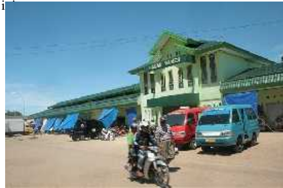
Gambar 3. Terminal Angkutan Umum di Pasar Wameo

Sebagai pusat perkotaan paling besar di Pulau Buton, Kota Baubau menjadi asal dan tujuan angkutan antar kota dalam provinsi (AKDP) terhadap wilayah kabupaten lain yang ada di Pulau Buton. Berdasarkan data dari Dinas Perhubungan Kota Buton, sesuai dengan perijinan terdapat 227 kendaraan AKDP yang terdiri dari 13 trayek AKDP dengan asal tujuan kota Baubau. Kendaraan paling banyak adalah angkuta AKDP jurusan Baubau – Masalimu (Kabupaten Buton) dengan jumlah kendaraan sebesar 65 unit, sedangkan yang paling kecil adalah angkutan AKDP jurusan Baubau – Barangka (Kabupaten Buton) dengan jumlah kendaraan sebesar 2 unit. Gambaran selengkapnya tentang jumlah angkutan AKDP di Wilayah Kota Baubau, selanjutnya dapat dilihat pada tabel berikut