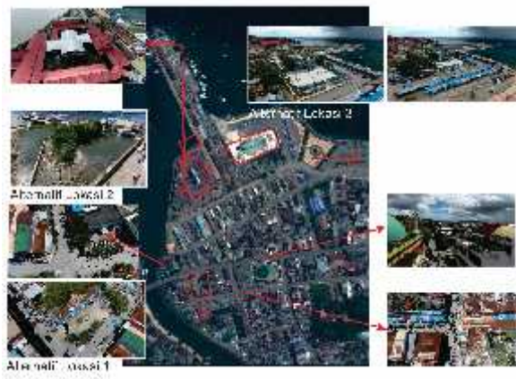
Gambar 3. Kondisi Eksisting Wilayah Studi

Lokasi Tapak sekitar kawasan terletak di sekitar pasar dan masjid agung. Di sebelah barat tapak, tepat berseberangan dengan jalan trans Sulawesi, terdapat pemukiman penduduk dengan tingkat kepadatan yang masih rendah, walaupun dapat dikatakan kegiatan perekonomian di sekitar tapak tampaknya cukup lancar dan berkembang. Hal ini dikarenakan oleh posisi kawasan yang strategis.