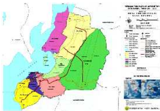
Gambar 1. Peta Administrasi Kota Baubau Sumber : RTRW Kota Baubau 2011-2030

Secara geografis Kota Baubau terletak di bagian Selatan Provinsi Sulawesi Tenggara yang berupa wilayah kepulauan. Kota Baubau berada di Pulau Buton dengan posisi koordinat sekitar 0,5°15' hingga 0,5°32' Lintang Selatan dan